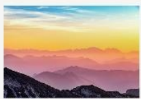
Reserva de la Biosfera de la Sierra Gorda Querétaro México