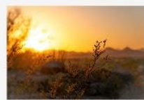
Reserva de la Biosfera Tehuacán-Cuicatlán México