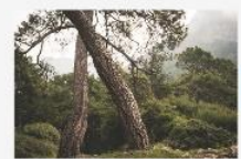
Bosque de la primavera Jalisco México